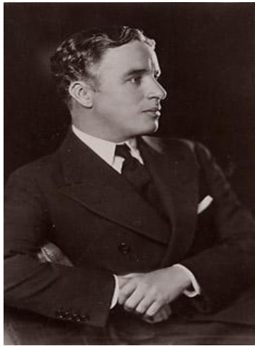
Chaplin – 1920